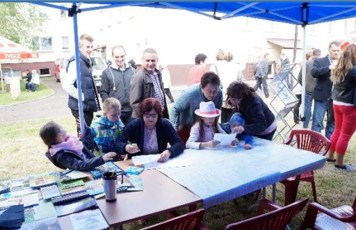
Dni Walce – Gmina Walce