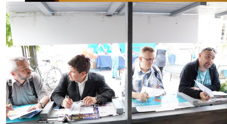
Targi Turystyki - Opole