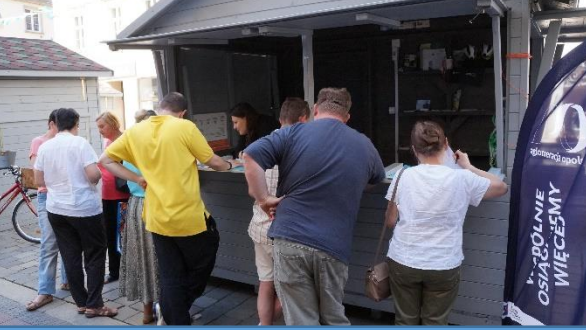
Targi Turystyki - Opole