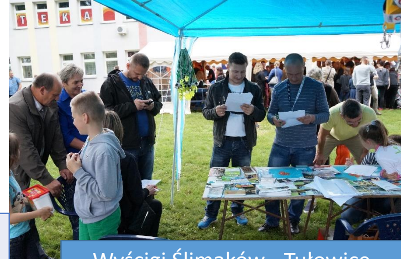
Wyścigi Ślimaków - Tułowice